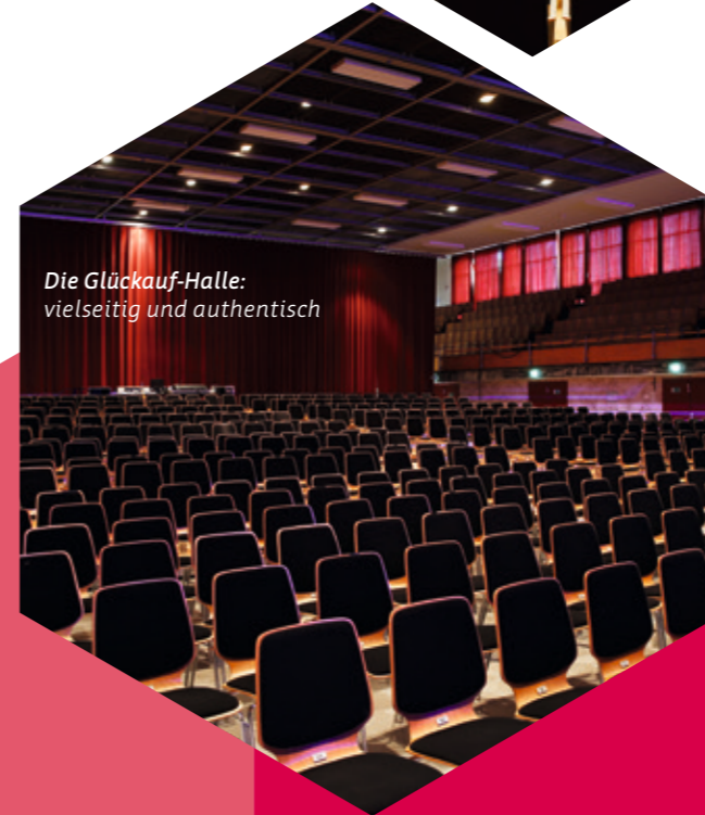
Die Glückauf-Halle: vielseitig und authentisch