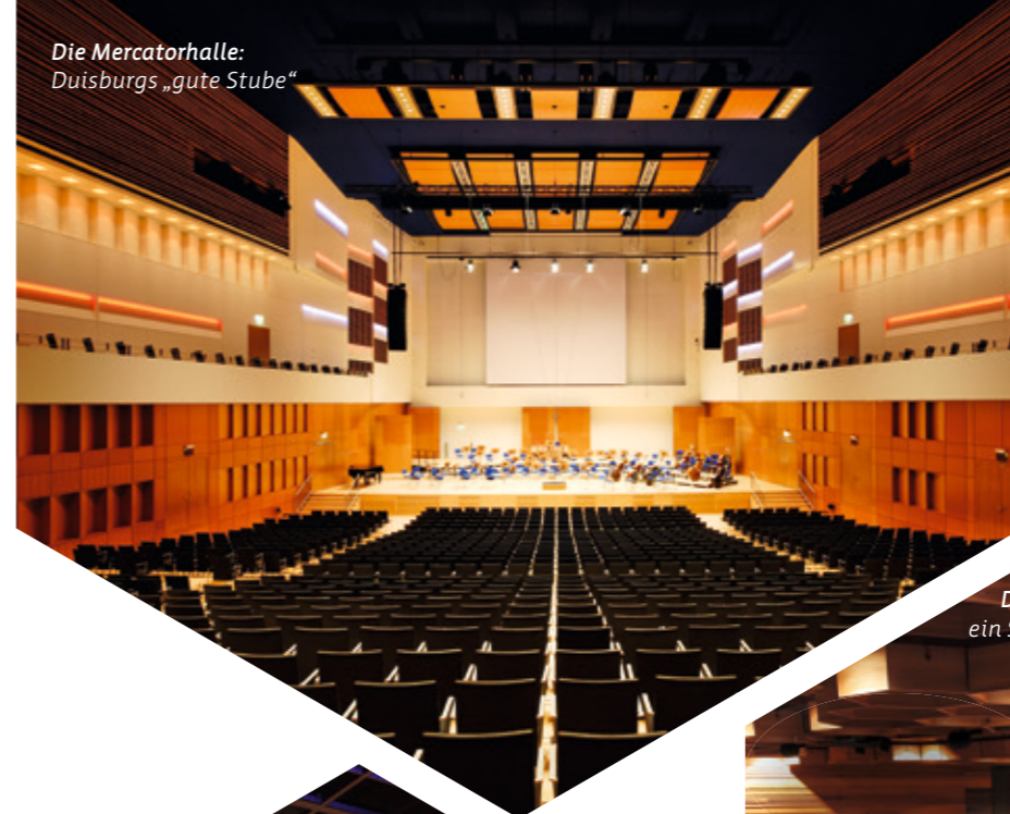
Die Mercatorhalle: Duisburgs „gute Stube“